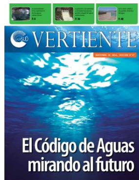
Edición 17, año 2016