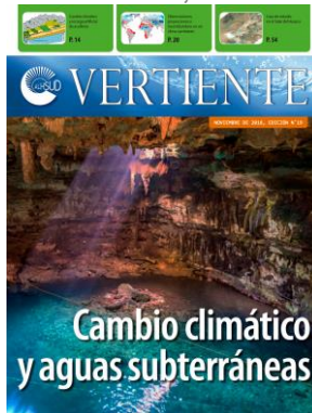
Edición 19, año 2018