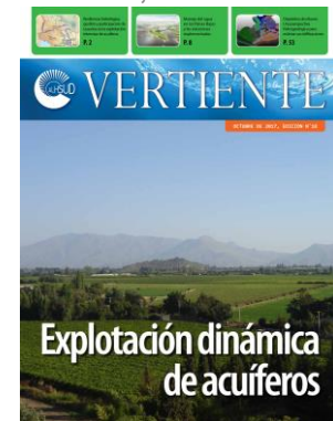
Edición 18, año 2017