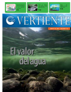
Edición 15, año 2014