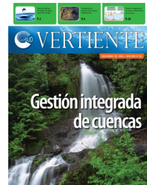
Edición 16, año 2015